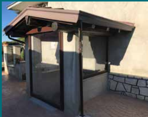
44 - Tenda invernale