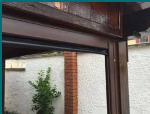
04 - Tenda invernale