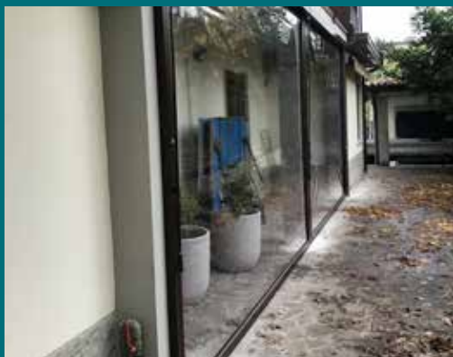
40 - Tenda invernale