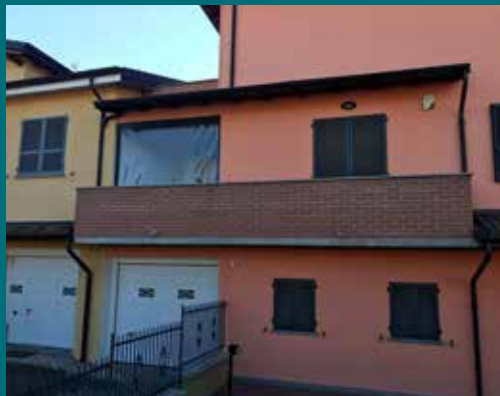
26 - Tenda invernale