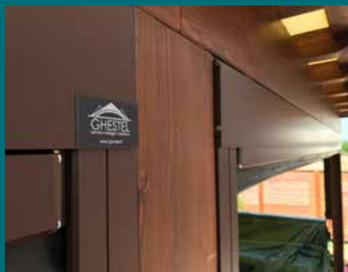
34 - Tenda invernale