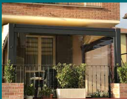
31 - Tenda invernale