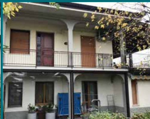
39 - Tenda invernale