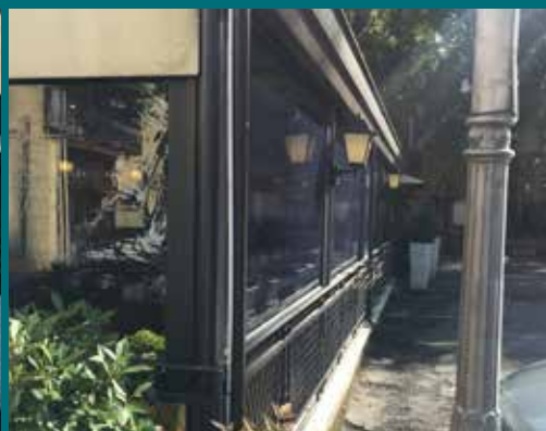
17 - Tenda invernale