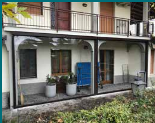
38 - Tenda invernale