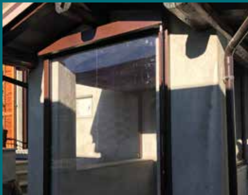
43 - Tenda invernale