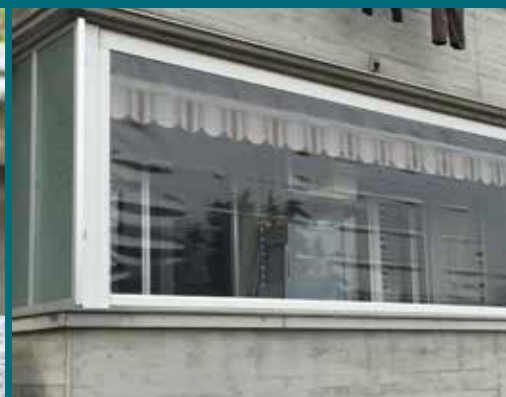
09 - Tenda invernale

GHESTEL fornisce ed installa coperture fisse e mobili, adatte a qualsiasi tipo di esigenza. GHESTEL vi segue con un servizio completo di assistenza e manutenzione.