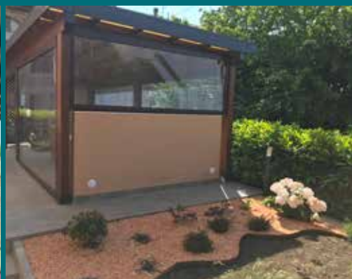
35 - Tenda invernale