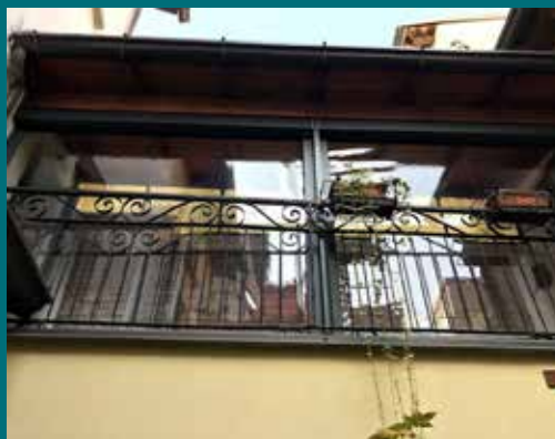
23 - Tenda invernale