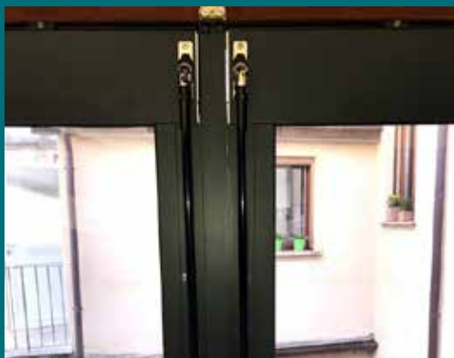
22 - Tenda invernale