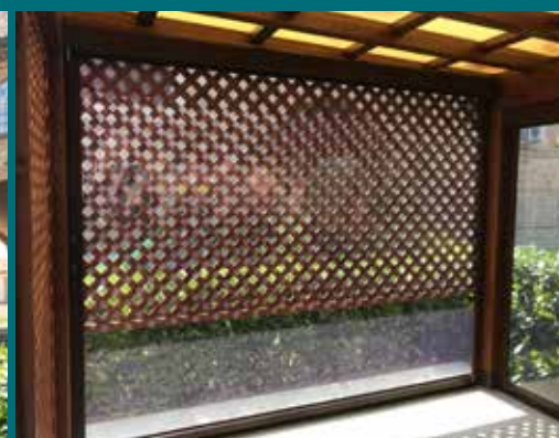
33 - Tenda invernale