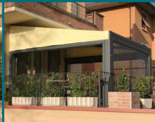
30 - Tenda invernale