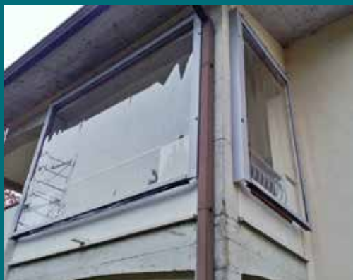
02 - Tenda invernale