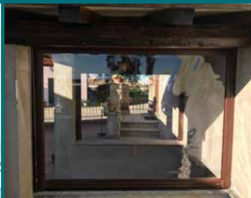
42 - Tenda invernale