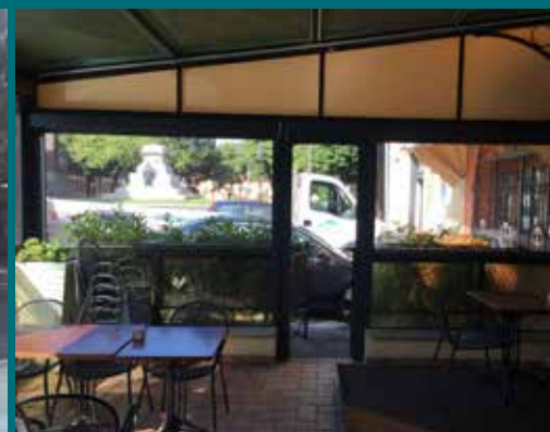
18 - Tenda invernale

GHESTEL fornisce ed installa coperture fisse e mobili, adatte a qualsiasi tipo di esigenza. GHESTEL vi segue con un servizio completo di assistenza e manutenzione.