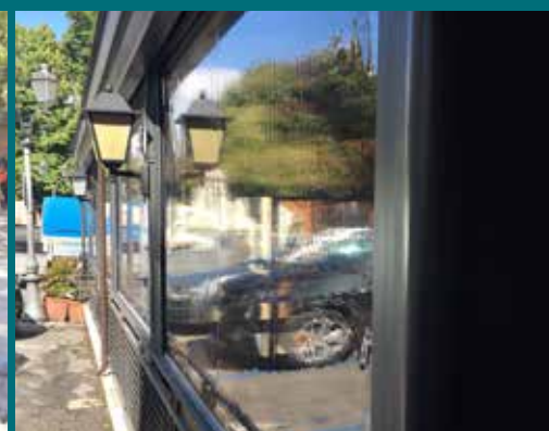
15 - Tenda invernale