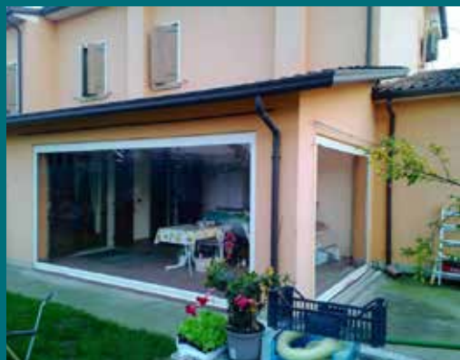
01 - Tenda invernale

Prodotto poco invasivo dal punto di vista visivo e allo stesso tempo con un'estetica elegante e adatta alle diverse tipologie di spazi da chiudere. Telaio in alluminio verniciato, guide laterali telescopiche con sistema brevettato di fissaggio telo per condizioni climatiche particolari, ganci di arresto realizzati per la tensione del telo, asta di manovra snodata e completa di fermo (possibilità di motorizzazione con gestione tramite telecomando), cassonetto ispezionabile per la pulizia del telo, tessuti trasparenti, oscuranti, filtranti e molto altro, disponibile in diverse colorazioni.