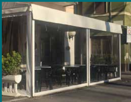
10 - Tenda invernale

Prodotto poco invasivo dal punto di vista visivo e allo stesso tempo con un'estetica elegante e adatta alle diverse tipologie di spazi da chiudere. Telaio in alluminio verniciato, guide laterali telescopiche con sistema brevettato di fissaggio telo per condizioni climatiche particolari, ganci di arresto realizzati per la tensione del telo, asta di manovra snodata e completa di fermo (possibilità di motorizzazione con gestione tramite telecomando), cassonetto ispezionabile per la pulizia del telo, tessuti trasparenti, oscuranti, filtranti e molto altro, disponibile in diverse colorazioni.