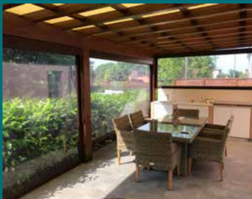
37 - Tenda invernale

Prodotto poco invasivo dal punto di vista visivo e allo stesso tempo con un'estetica elegante e adatta alle diverse tipologie di spazi da chiudere. Telaio in alluminio verniciato, guide laterali telescopiche con sistema brevettato di fissaggio telo per condizioni climatiche particolari, ganci di arresto realizzati per la tensione del telo, asta di manovra snodata e completa di fermo (possibilità di motorizzazione con gestione tramite telecomando), cassonetto ispezionabile per la pulizia del telo, tessuti trasparenti, oscuranti, filtranti e molto altro, disponibile in diverse colorazioni.