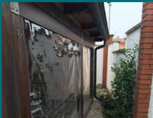
05 - Tenda invernale