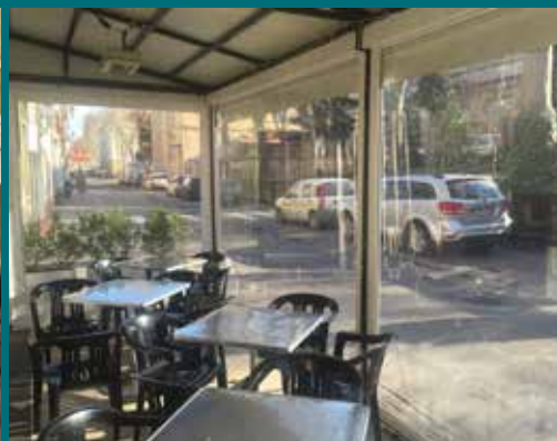
11 - Tenda invernale