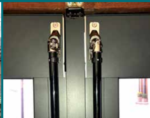
21 - Tenda invernale