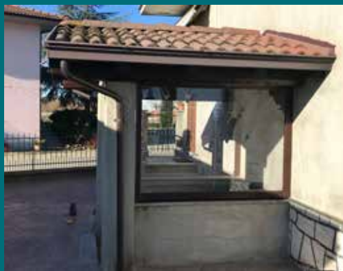
41 - Tenda invernale