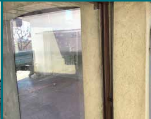
45 - Tenda invernale

GHESTEL fornisce ed installa coperture fisse e mobili, adatte a qualsiasi tipo di esigenza. GHESTEL vi segue con un servizio completo di assistenza e manutenzione.