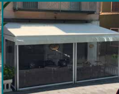
12 - Tenda invernale