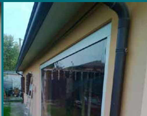
03 - Tenda invernale