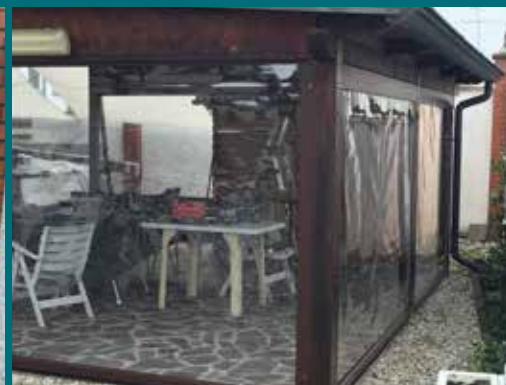
06 - Tenda invernale