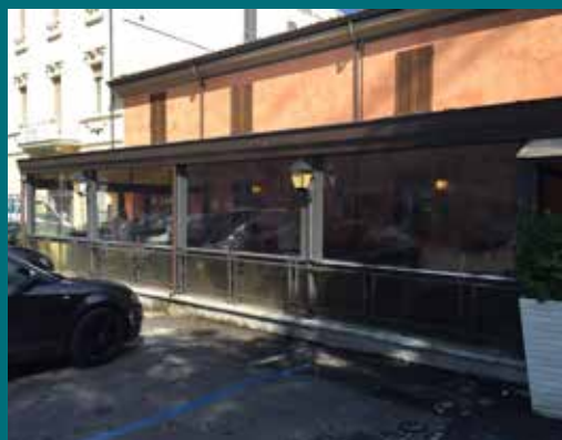
16 - Tenda invernale