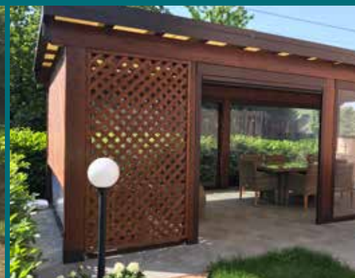
36 - Tenda invernale

GHESTEL fornisce ed installa coperture fisse e mobili, adatte a qualsiasi tipo di esigenza. GHESTEL vi segue con un servizio completo di assistenza e manutenzione.