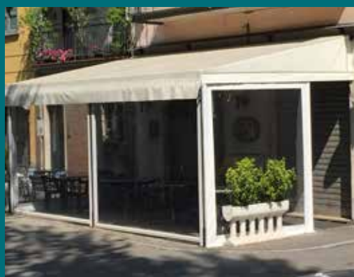
13 - Tenda invernale