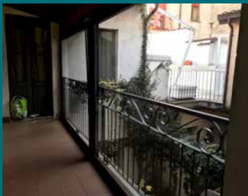
19 - Tenda invernale

Prodotto poco invasivo dal punto di vista visivo e allo stesso tempo con un'estetica elegante e adatta alle diverse tipologie di spazi da chiudere. Telaio in alluminio verniciato, guide laterali telescopiche con sistema brevettato di fissaggio telo per condizioni climatiche particolari, ganci di arresto realizzati per la tensione del telo, asta di manovra snodata e completa di fermo (possibilità di motorizzazione con gestione tramite telecomando), cassonetto ispezionabile per la pulizia del telo, tessuti trasparenti, oscuranti, filtranti e molto altro, disponibile in diverse colorazioni.