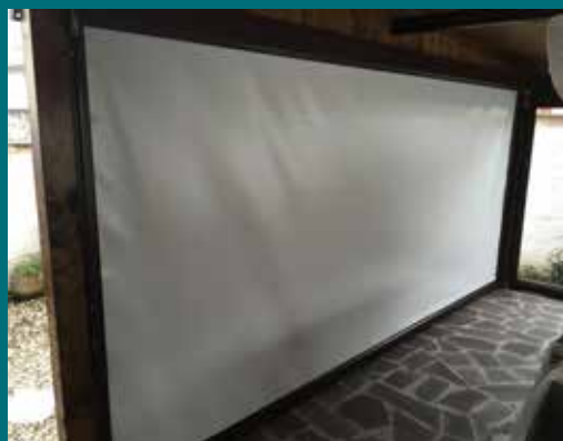
07 - Tenda invernale