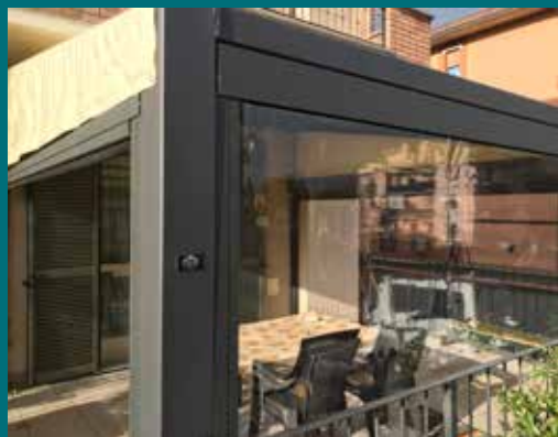
28 - Tenda invernale

Prodotto poco invasivo dal punto di vista visivo e allo stesso tempo con un'estetica elegante e adatta alle diverse tipologie di spazi da chiudere. Telaio in alluminio verniciato, guide laterali telescopiche con sistema brevettato di fissaggio telo per condizioni climatiche particolari, ganci di arresto realizzati per la tensione del telo, asta di manovra snodata e completa di fermo (possibilità di motorizzazione con gestione tramite telecomando), cassonetto ispezionabile per la pulizia del telo, tessuti trasparenti, oscuranti, filtranti e molto altro, disponibile in diverse colorazioni.