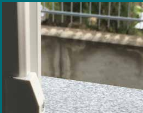
08 - Tenda invernale